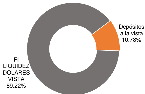
Portafolio por instrumento 31/12/2018